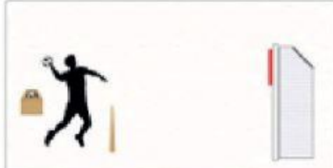
5. Hentbol Topu ile Hedefe Şut Atma