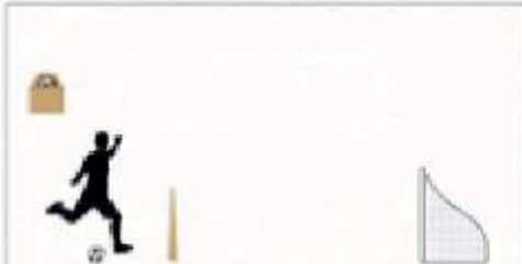
4. Minyatür Futbol Kalesine Şut Atma