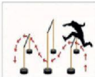
7. Engel Üzerinden Sıçrama ve Altından Geçiş