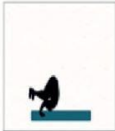
1. Öne Takla