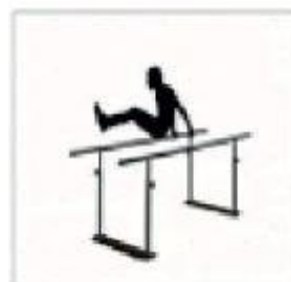
8. Paralelden Geçiş